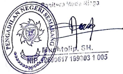
Foto Copy / Salinan Sesuai Dengan Aslinya Pengadilan Negeri / Niaga Semarang U.b. Panitera Panitera Muda Niaga